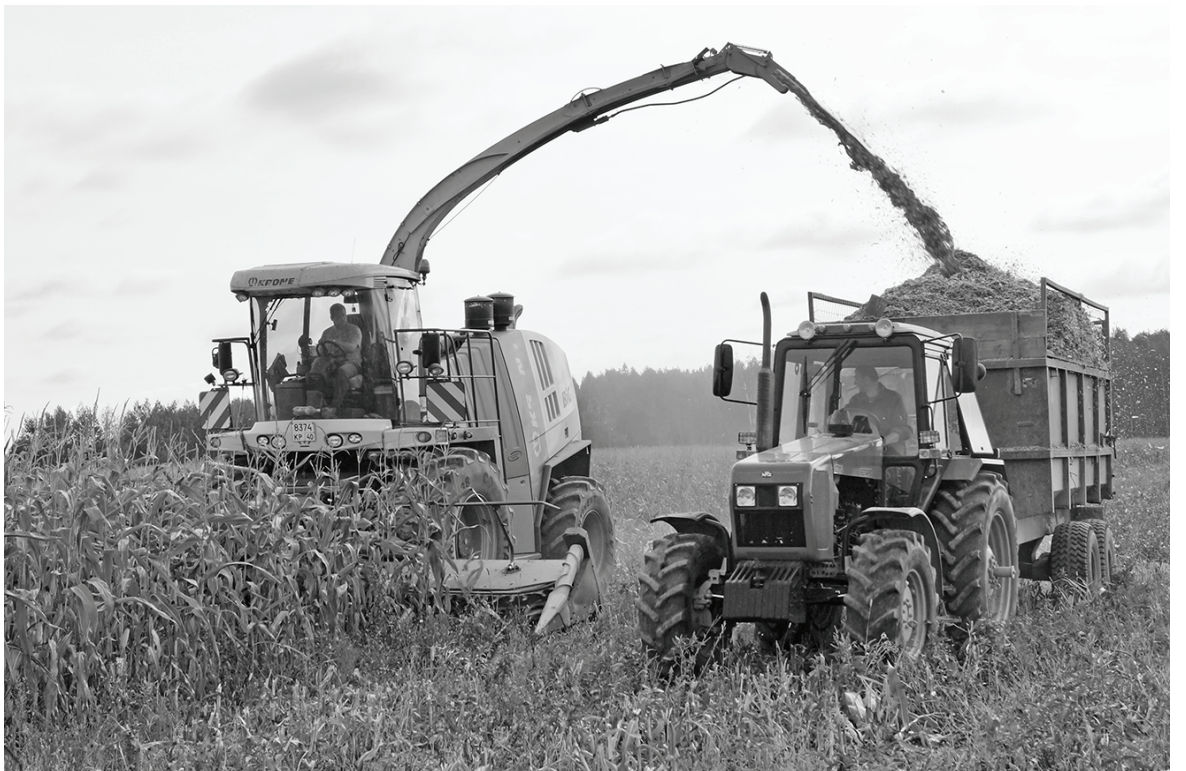
Уборка кукурузы в агрофирме «Кадви».

По информации отдела сельского хозяйства и продовольствия.