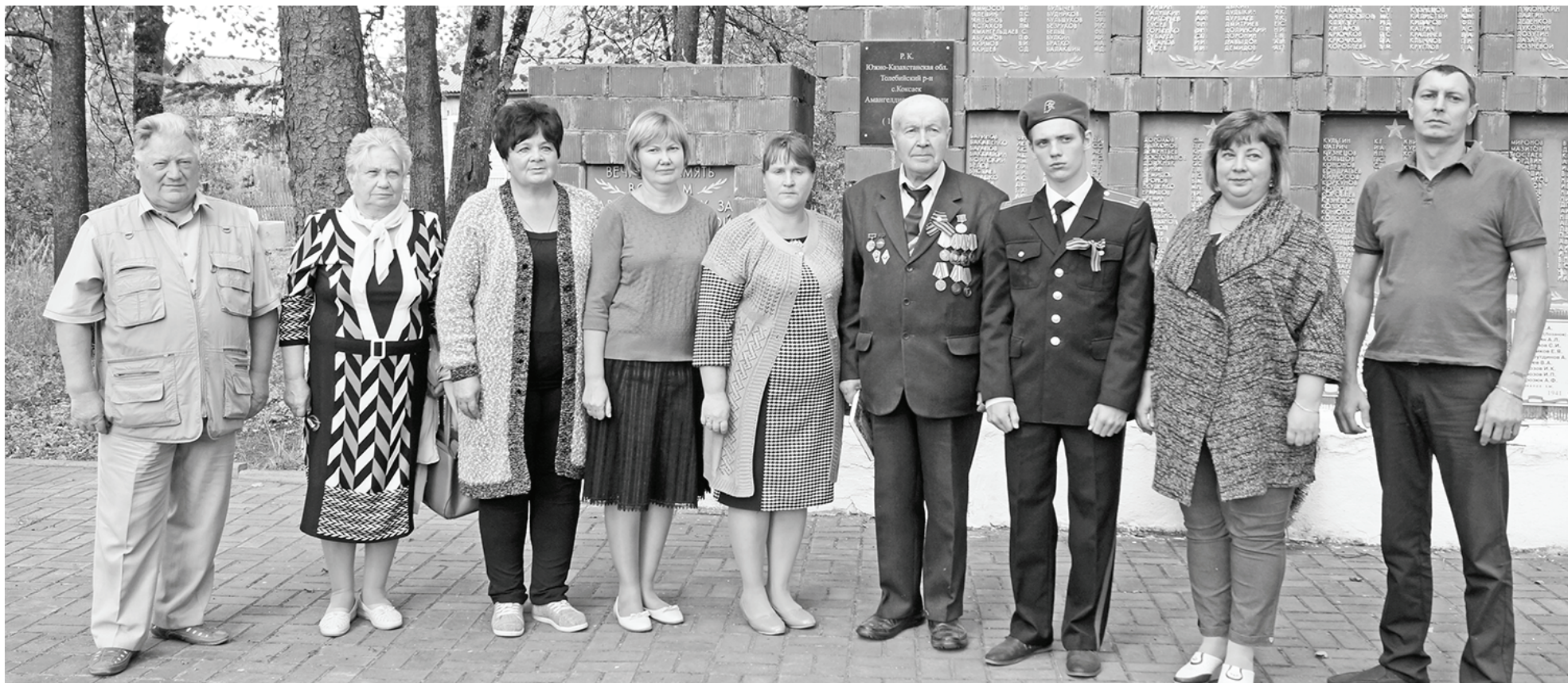
Участники встречи в Брыни посетили сельский мемориал.