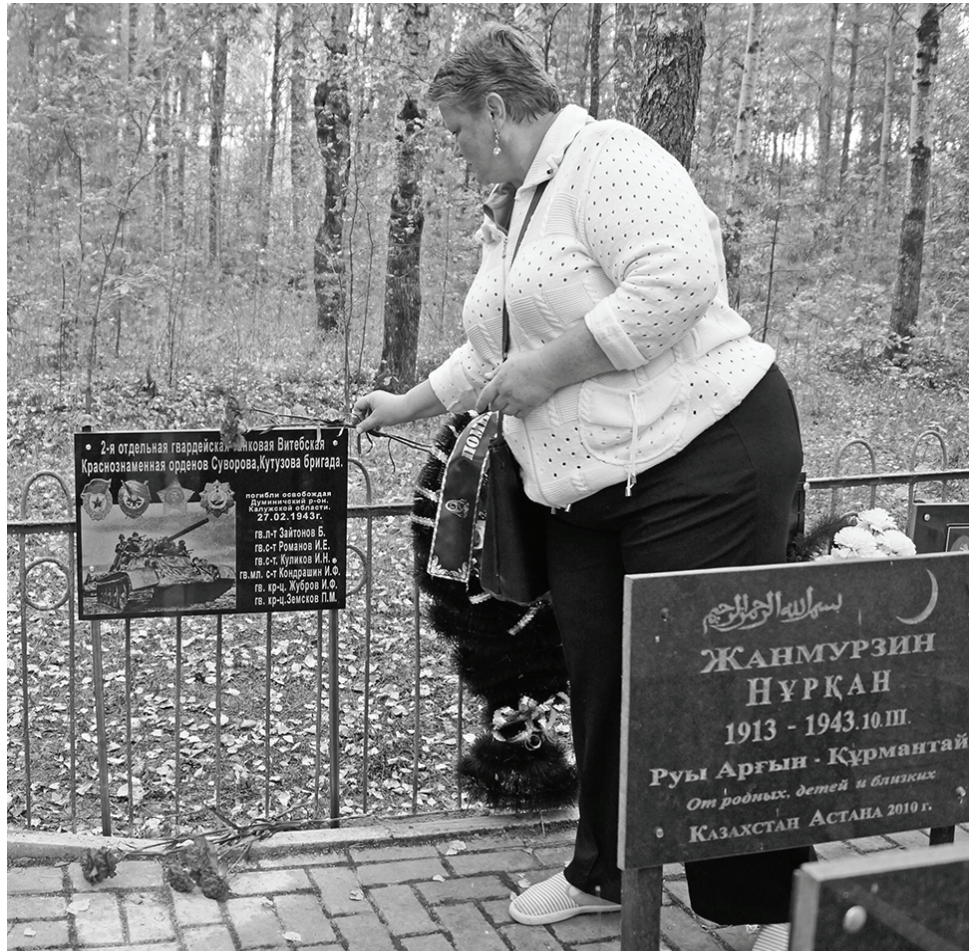
Цветы скопинским гвардейцам.